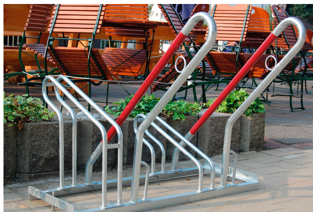
Fahrradständer Typ 2500