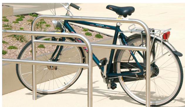
Fahrradanlehnbügel Typ Leon, mit Querholm