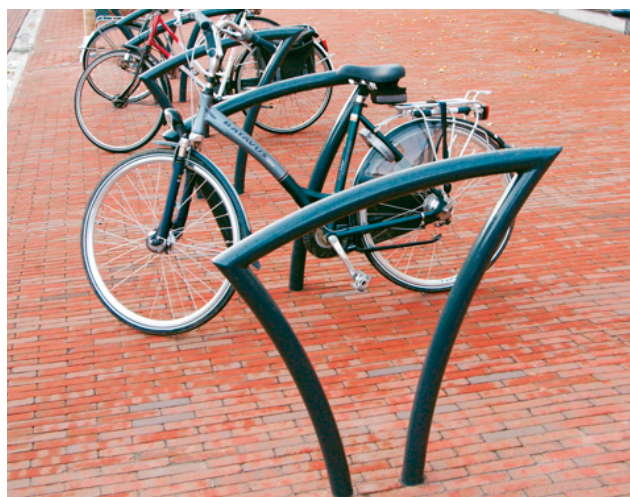
Fahrradanlehnbügel Typ Pi