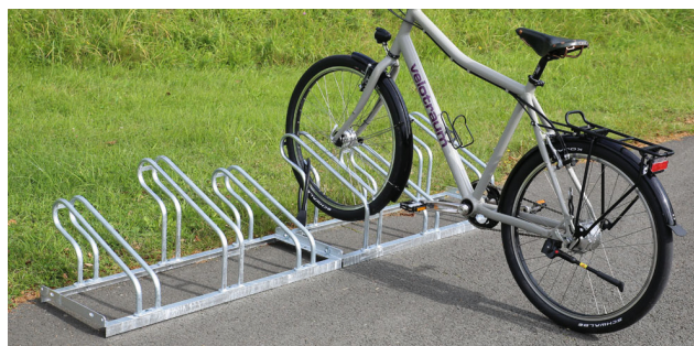
Fahrradständer Typ 2000

Gerne erstellen wir Ihnen ein unverbindliches Angebot.