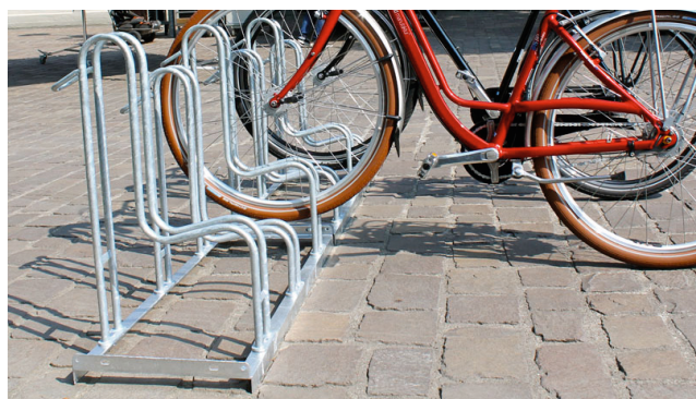
Fahrradständer Typ 4000