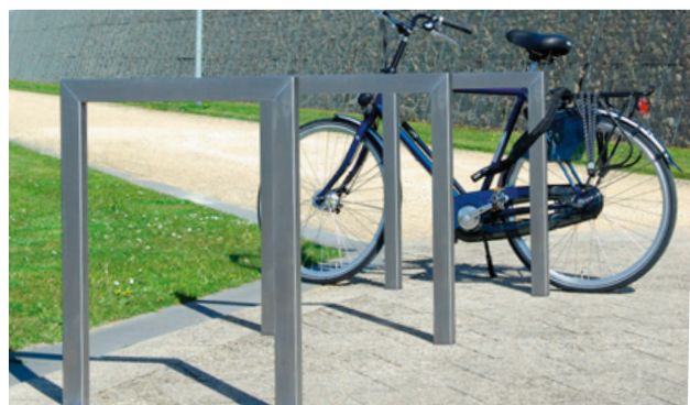
Fahrradanlehnbügel Typ Scala